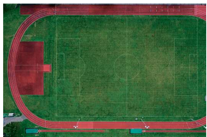
Die Churer Sportlerinnen und Sportler trainieren in Zukunft auch auf der Leichtathletikanlage in Landquart.

KLARTEXT Seite 2 GRAUBÜNDEN Seite 3 KULTUR Seite 13 NACHRICHTEN Seite 15 SPORT Seite 18 TV Seite 22 WETTER & BÖRSE Seite 23